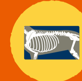
レントゲン (胸部・腹部)